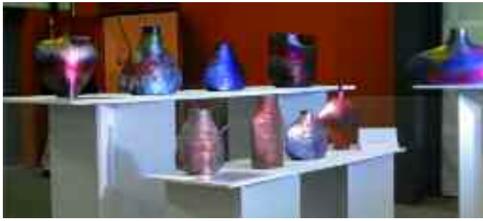
Poteries de Joan Carillo

Le 17 ème marché de Potiers de Roquettes s'est déroulé les 17 et 18 novembre.