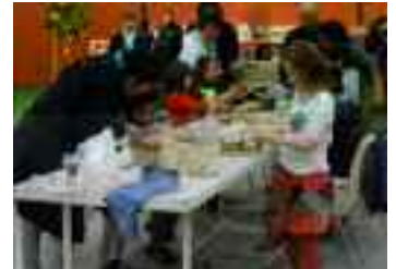
Illustration de l'atelier enfant du Marché de potiers

Je tiens à remercier tous les bénévoles qui s'impliquent sans compter et sans qui la réussite de ce marché ne serait pas possible.