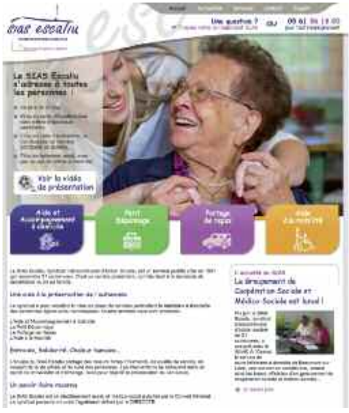
La page d'accueil du nouveau site du SIAS Escalieu consultable sur : www.sias-services.fr

Dans un style plus moderne tout en conservant les valeurs de solidarité et de chaleur humaine propres au syndicat, ce nouveau site abrite également une page Emploi, une carte des différentes communes membres ainsi qu'une page Actualité qui permet de suivre notamment l'avancée du Groupement de Coopération Sociale et Médico-Sociale en cours de développement.