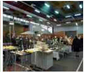
Allée de l'expo vente

Ceradel comme chaque année nous a fourni la terre afin que les enfants s'initient au modelage et la pépinière Bauduc nous a prêté des plantes qui agrémentent joliment cet espace.