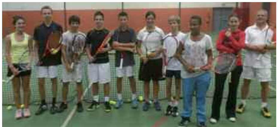
Entraînement des meilleurs ados : de gauche à droite :

chèque de 800€ le samedi 24 novembre à la salle des fêtes de Roques lors de la Nuit du Tennis.