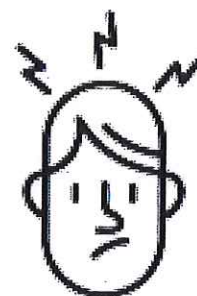
Maux de tête