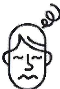
Vertiges / Nausées