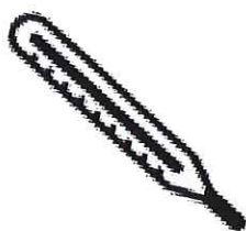
Fièvre > 38°C