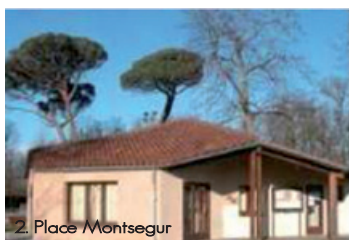
2. Place Montsegur