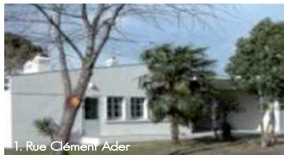
1. Rue Clément Ader