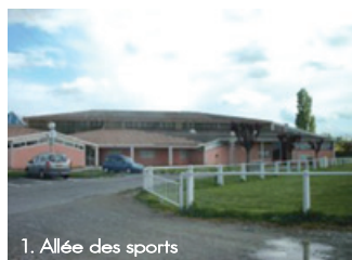
1. Allée des sports