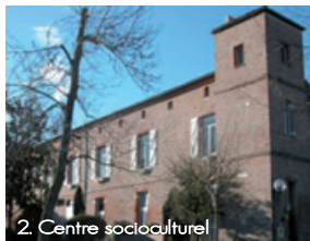
2. Centre socioculturel

1. Salle d'activités Clément Ader (encadrement, comité des fêtes, peinture sur soie, patchwork, secrétariat du foyer rural...)